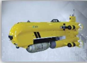
Systèmes Intelligents de Sûreté