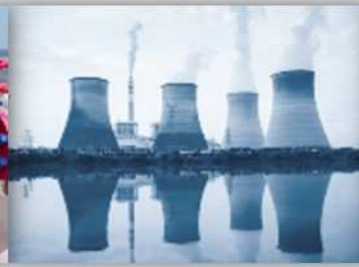
Protection en Milieux Nucléaires