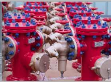
Projets et Services Industriels