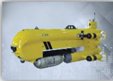
Systèmes Intelligents de Sûreté