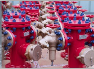
Projets et Services Industriels