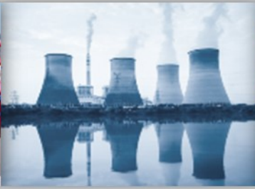
Protection en Milieux Nucléaires