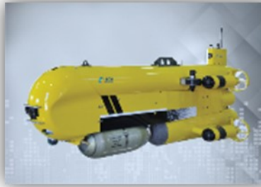
Systèmes Intelligents de Sûreté