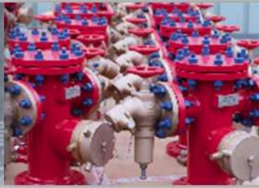
Projets et Services Industriels