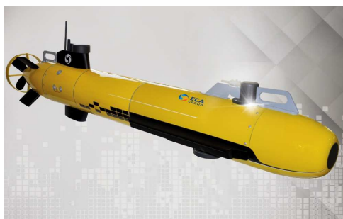
Systèmes Intelligents de Sûreté