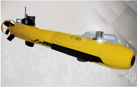
Systèmes Intelligents de Sûreté