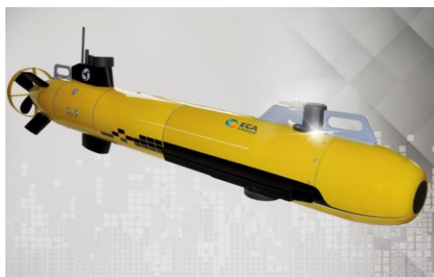
Systèmes Intelligents de Sûreté